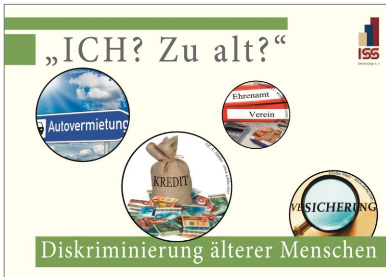
Abbildung 1: Postkartenaktion "Ich? Zu alt?"

auf Veranstaltungen (vor allem auf dem Deutschen Seniorentag) und im Einzelhandel (etwa in Apotheken in Frankfurt a. M. und Darmstadt) ausgelegt. Des Weiteren wurde in den Newslettern der Antidiskriminierungsstelle des Bundes (07/2018) und der Bundesarbeitsgemeinschaft der Senioren-Organisationen (Ausgabe 15/2018) sowie auf der Internetplattform des Kölner Büros gegen Altersdiskriminierung auf die Möglichkeit, sich für dieses Interview zu melden, aufmerksam gemacht. Zuletzt wurde über einen Verteiler des Sozialministeriums Rheinland-Pfalz ein Aufruf gestartet, sich bei Erfahrungen mit Altersdiskriminierung beim ISS-Frankfurt a. M. zu melden.